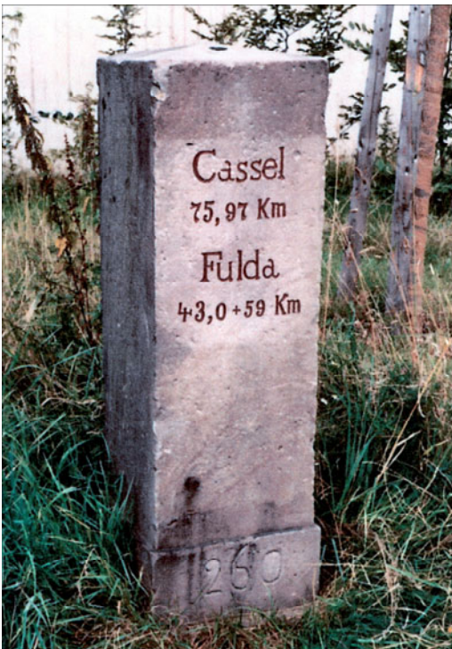
Abb. 9: Meilenstein Bad Hersfeld

"Cassel 4 M Arolsen 2 \frac{1}{4} M" "104"