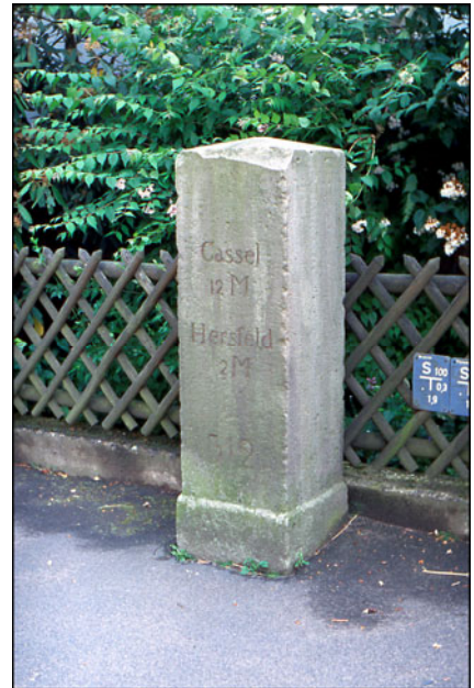
Abb. 8: Meilenstein Niederaula-Niederjossa