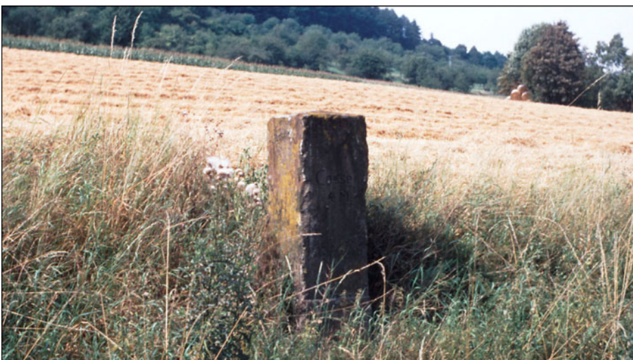
Abb. 10: Meilenstein Hundelshausen