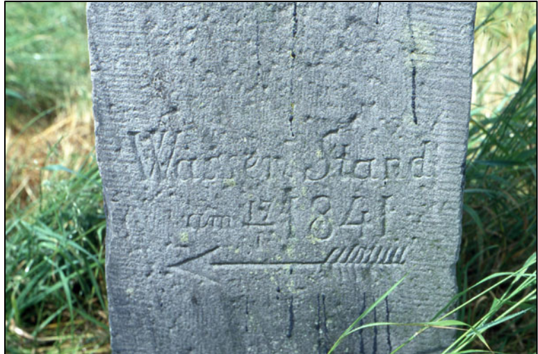
Abb. 1: Hochwassermarken am Meilenstein Mecklar

Weiterhin sind an der rechten Seite "Wasserstand am 17.I.1841" sowie der zugehörige Pegelstrich eingemeißelt. Der Stein steht eigentlich 9 Meilen von Kassel entfernt.