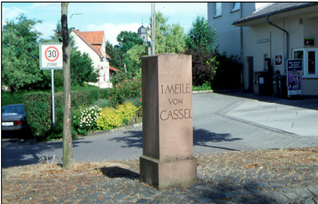
Abb. 5: Meilenstein Obervellmar