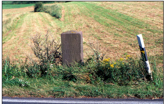
Abb. 6: Meilenstein Schwarzenborn (, 11.08.1998)