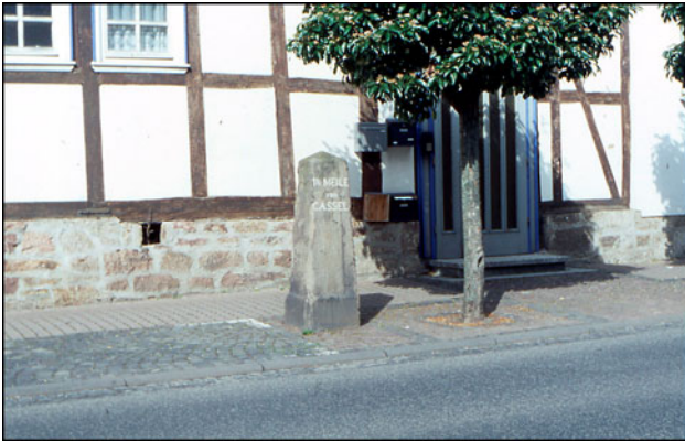
Abb. 7: Meilenstein Oberkaufungen