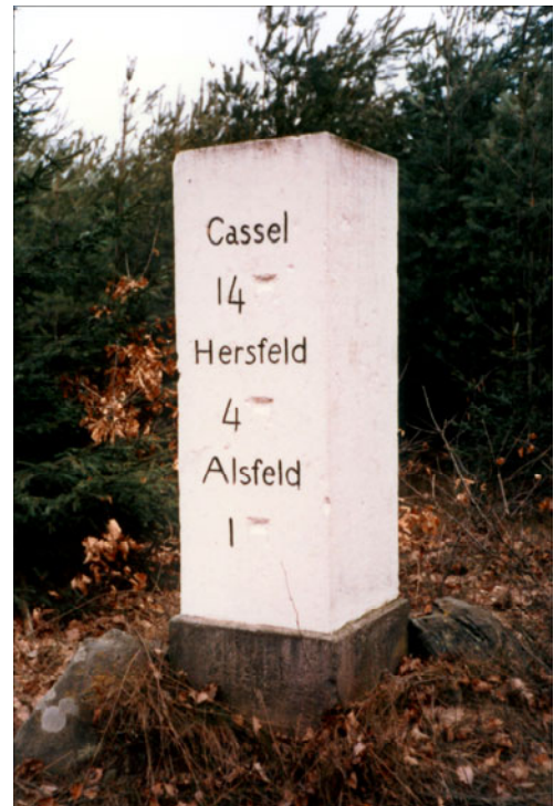
Abb. 10: Meilenstein Lingelbach